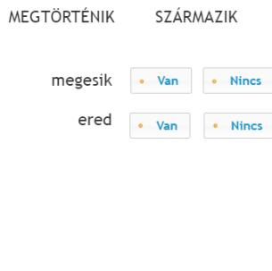
2. ábra. Példafeladat a programból: szinonimaolvasás feladat

Hasonlítsd össze a kisbetűs és nagybetűs szavakat! Döntsd el, van-e a kisbetűs szavaknak nagybetűs megfelelője! Ha van, kattints a "Van" felíratra, ha nincs, kattints a "Nincs" felíratra!