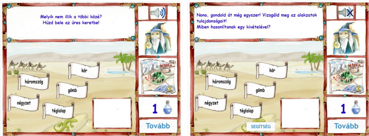
1. ábra. Példa egy tulajdonságok megkülönböztetése (kakuktkotás) feladatra, valamint a konstruktív visszajelzésre a feladatban

A matematikai fogalmak, műveletek játékos feladatokba ágyazva feloldhatják a tanulók esetleges ellenérzését a matematikával szemben, motiválón hathatnak a diákokra, valamint elősegíthetik a tananyag mélyebb megértését is.