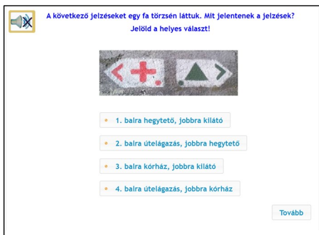
2. ábra: Példafeladat a) az értő olvasás és a helyesírási készség fejlesztéséhez, b) az értő olvasás fejlesztéséhez